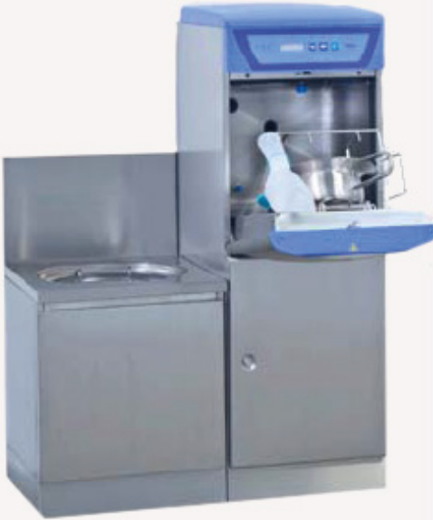
• Pleiekombinasjon 900 mm, består av bekkenspyler og utslagsvask