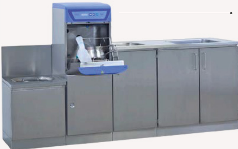
• Pleiekombinasjon 2250 mm, består av bekkenspyler, 900 mm underskap med vaskeum, 450 mm underskap med håndvask og utslagsvask