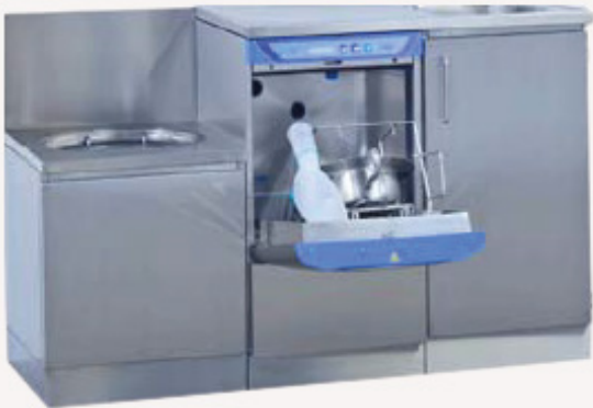
• Pleiekombinasjon 1350 mm, består av bekkenspyler, 450 mm underskap med håndvask og utslagsvask